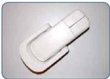
Obrázok 2.2 Diaľkový ovládač

Diaľkový ovládač nebude fungovať, ak je sedadlo zakryté krytom.