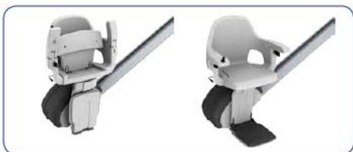
Obr. 2.4 Zložená a rozložená stolička

Pri parkovaní môžeme stoličkový výtah zložiť.