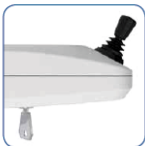
Obrázok 2.1 Páčková ovládač – joystick na opierke, ktorým sa ovláda pohyb hore a dole na sedačke. Odspodu vidíme zasunutý kľúčik.

Kľúčik musí byť zasunutý do podrúčky, ak sa výťahom pohybujeme.