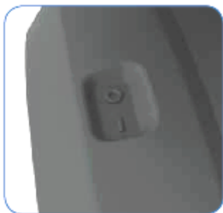
Obr. 2.3 Hlavný vypínač

Nachádza sa pod kreslom na motorovej jednotke.